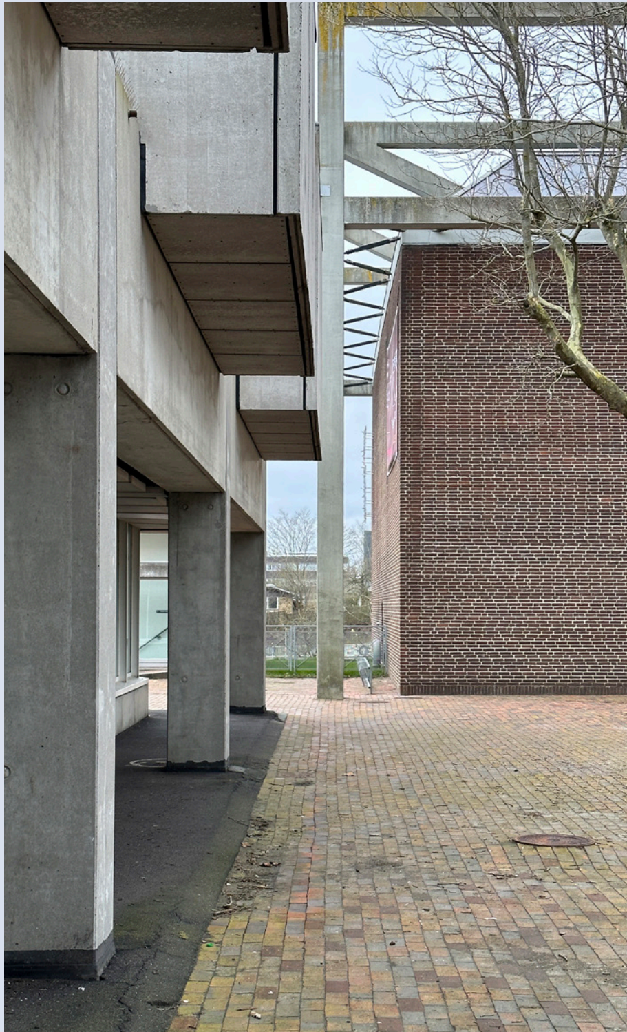
Gellerupparken 1968-72. Arkitekterne Knud Blach Petersen og Mogens Harbo.