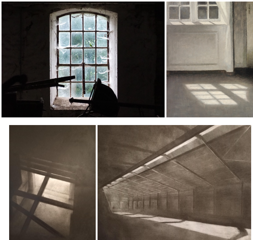
BA4 / Lys og skygge Studier af diverse vinduer på site og af forbilleder (eksempelvis som her - Hammershøi), herefter optegnes vinduer med tusch og farvelægges med tørpastel