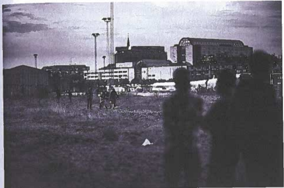
Figur 7.2: Unge samles i udkanten af byen før koncerten.