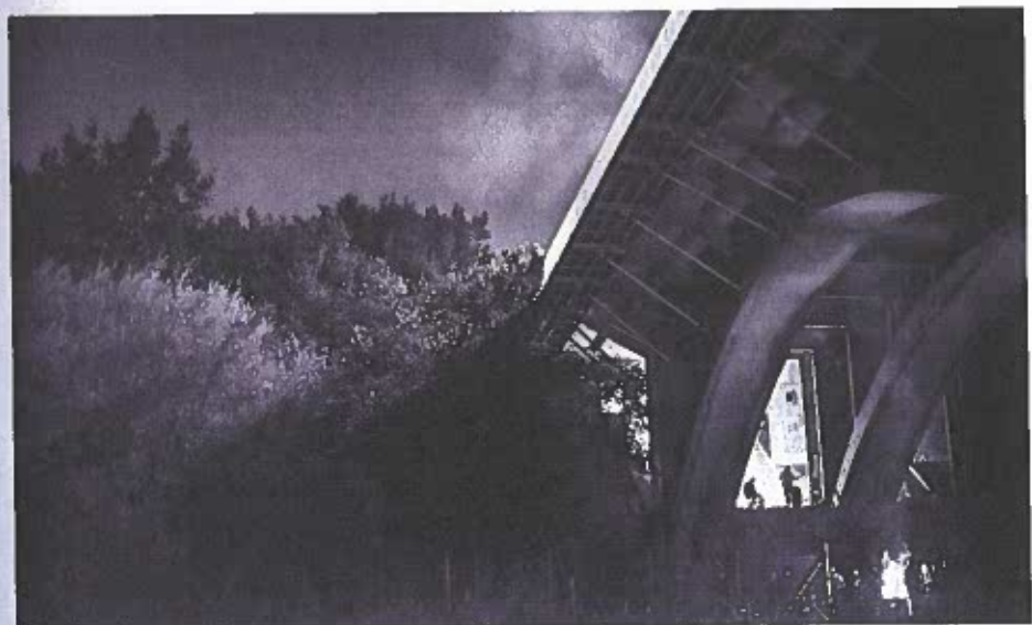
Figur 7.3: Om natten spiller bandsene på 'scenen', som er et podium, der er sat op mellem broens betonpæle.

Det, at de arrangerede deres egne koncerter, fik dem til at reflektere over forskellen mellem at arrangere koncerter i byrummet og arrangere koncerter på officielle spillesteder. De følte, at byrummet gav mange flere deltagelsesmuligheder.