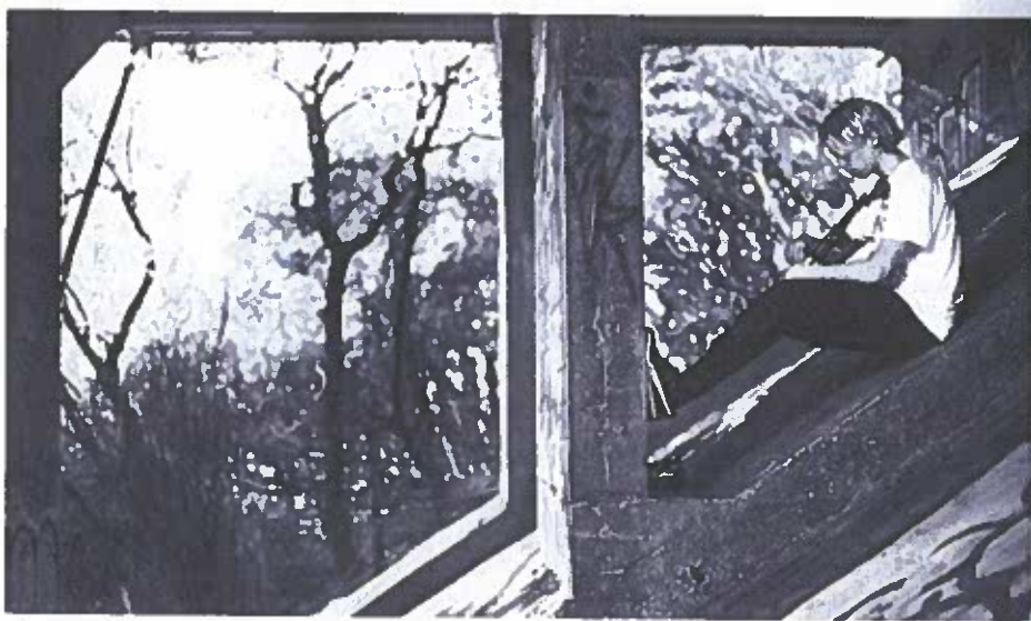
Figur 7.1: En ung mand øver sig på sin violin under broen.

Fem unge mænd i begyndelsen af tyverne arrangerede deres egne koncerter under en bro midt i en større dansk by. Over en treårig periode afholdt de tre koncerter med deltagelse af op mod 300 unge ved hver koncert. De fem mænd arrangerede selv koncerterne uden inddragelse af formelle institutioner og voksne. De benyttede sig af Facebook og deres egne sociale netværk i den sociale del af planlægningen (se Sand, 2018). Koncerterne var gratis for alle, som deltog, og de unge arrangører solgte billig øl til koncerterne for at dække omkostningerne til leje af den generator, som leverede strøm til bandets instrumenter.