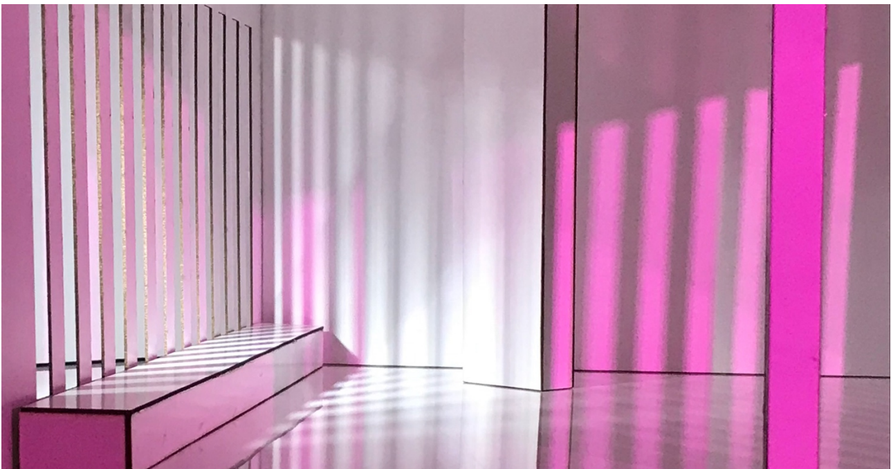
Figur 2. En studerendes undersøgelse af farvet lys i rum.

For det andet. Gør dig nogle tanker om, hvordan du i din fremtidige designkarriere vil arbejde med farven. Er der nogle særlige metoder, du har forelsket dig i? Har du set noget i din branche, som trænger til et løft? For eksempel er der en joke blandt designere om, at arkitekter kun kender tre farver: sort, hvid og antracitgrå. Kan dit arbejde være med til at udfordre dette?