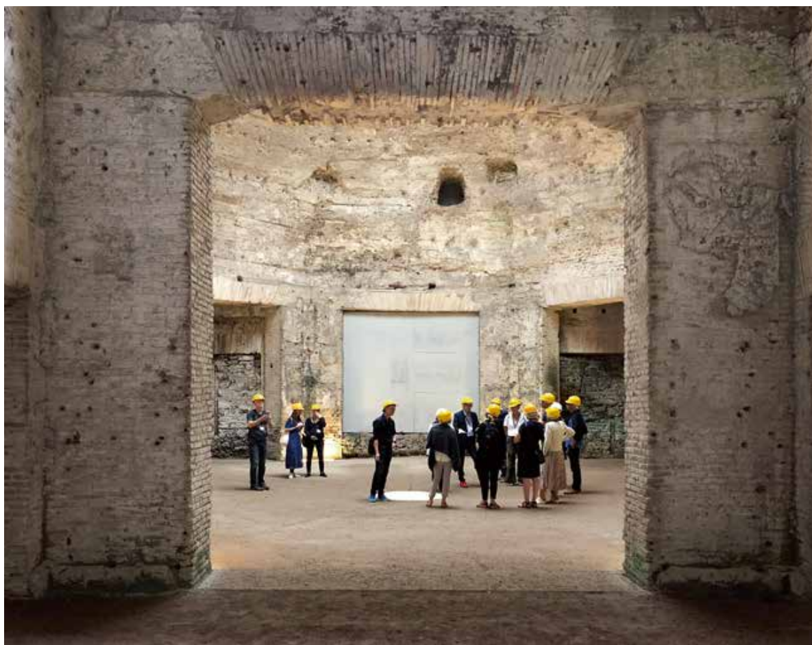
Domus Aurea, det oktagonale rum, Rom, 64 e.Kr.

Christoffer Thorborg er arkitekt MAA, ph.d. og adjunkt ved Arkitektskolen Aarhus.