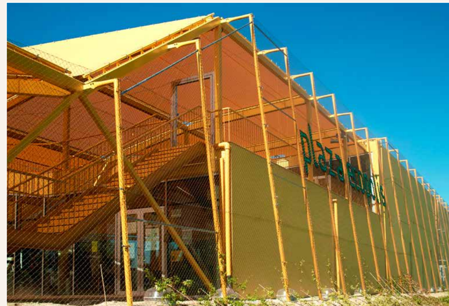
Ecópolis Plaza, Rivas, Madrid, 2010. Ecosistema Urbano.