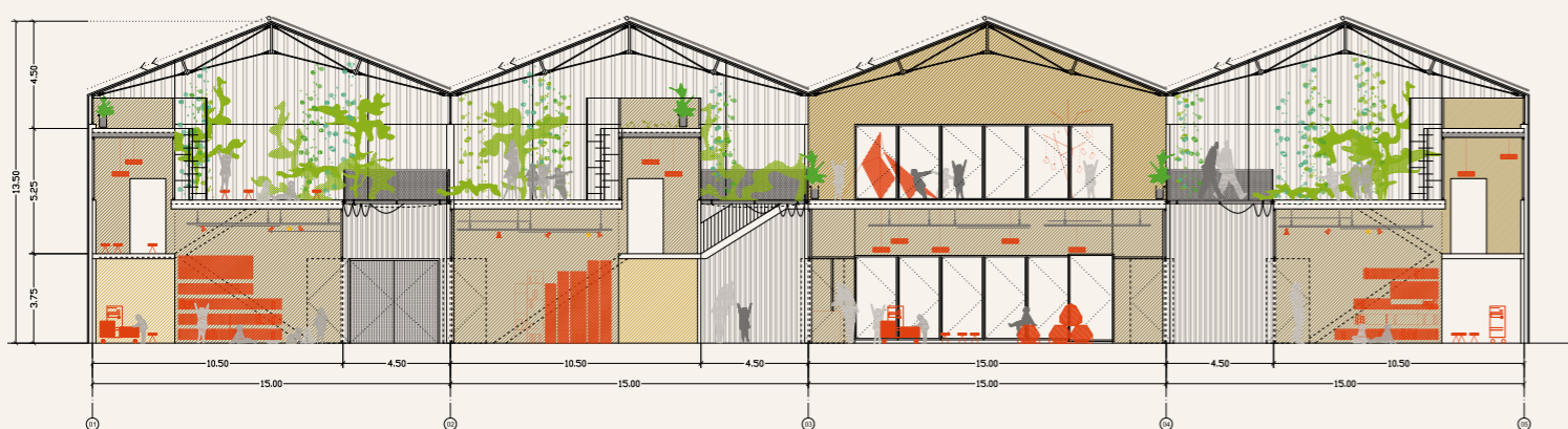
Tværsnit Reggio Children School. Vundet konkurrence, Reggio Emilia, 2012. Ecosistema Urbano.

og olie. Arkitekter, der taler til andre arkitekter. Vi tror på arkitekturens sociale rolle og dens forpligtigelse til at tilbyde samfundet løsninger. Så lad os lytte, lad os være mere åbne og være løsningsorienterede i forhold til de behov, samfundet møder os med.