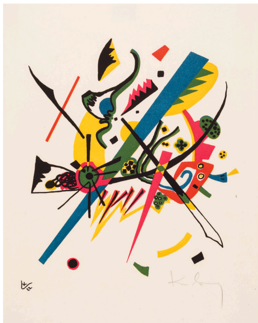
Blad I. Wassily Kandinsky: Små verdener I , 1922. Farvelitografi. 247 x 218 mm. Statens Museum for Kunst.

betegner ”Kandinskys abstraktion [som] resultat af en proces, der reducerer genkendelige figurer fra hans tidlige ekspressive maleri til frie billedmæssige eller ikoniske, elementer”, ligesom Würtz Frandsen påpeger ”en billedmæssig energetik, fremkaldt af modsatrettede bevægelser” 2