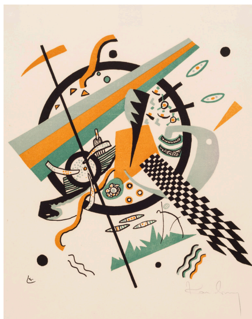
Blad IV. Wassily Kandinsky: Små verdener IV , 1922. Farvelitografi. 267 x 256 mm. Statens Museum for Kunst.