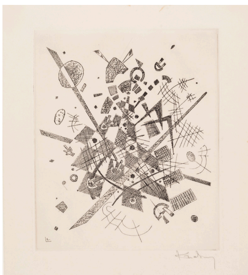
Blad IX. Wassily Kandinsky: Små verdener IX , 1922. Koldnålsradering. 237 x 200 mm. Statens Museum for Kunst.

Et billede kan i sig selv beskrives som et mikrokosmos, en egen lille verden, der virker igennem sine egne ordener heriblandt i og med sin komposition. Således kan vi beskrive Små verdener som