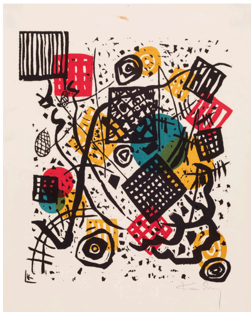
Blad V. Wassily Kandinsky: Små verdener V , 1922. Farvetræsnit. 275 x 235 mm. Statens Museum for Kunst.

Selve billedfladen, den grafiske grund, hvorfra figurationen kommer til syne, artikulerer Kandinsky på forskellig vis. Særligt i den sidste del af serien (blad X-XII) synes figurerne at bevæge sig frit hen over fladen, der enten kan aflæses som noget dybere bagvedliggende eller som i plan med figurerne, det er til stede immanent i selve papiret.