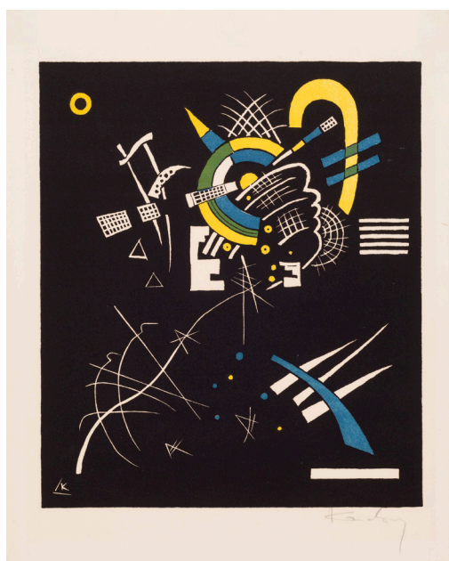
Blad VII. Wassily Kandinsky: Små verdener VII , 1922. Farvetræsnit. 271 x 233 mm. Statens Museum for Kunst.