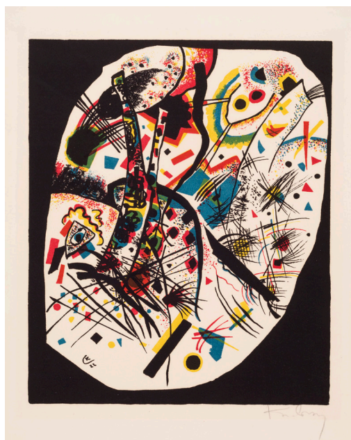
Blad III. Wassily Kandinsky: Små verdener III , 1922. Farvelitografi. 278 x 230 mm. Statens Museum for Kunst.