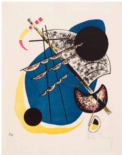
Blad II. Wassily Kandinsky: Små verdener II , 1922. Farvelitografi. 254 x 211 mm. Statens Museum for Kunst.