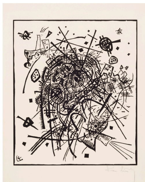
Blad VIII. Wassily Kandinsky: Små verdener VIII , 1922. Træsnit. 273 x 233 mm. Statens Museum for Kunst.