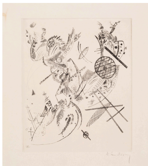
Blad XII. Wassily Kandinsky: Små verdener XII , 1922. Koldnålsradering. 237 x 197 mm. Statens Museum for Kunst.