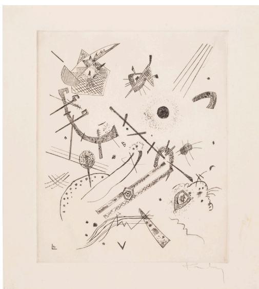
Blad XI. Wassily Kandinsky: Små verdener XI , 1922. Koldnålsradering. 238 x 199 mm. Statens Museum for Kunst.