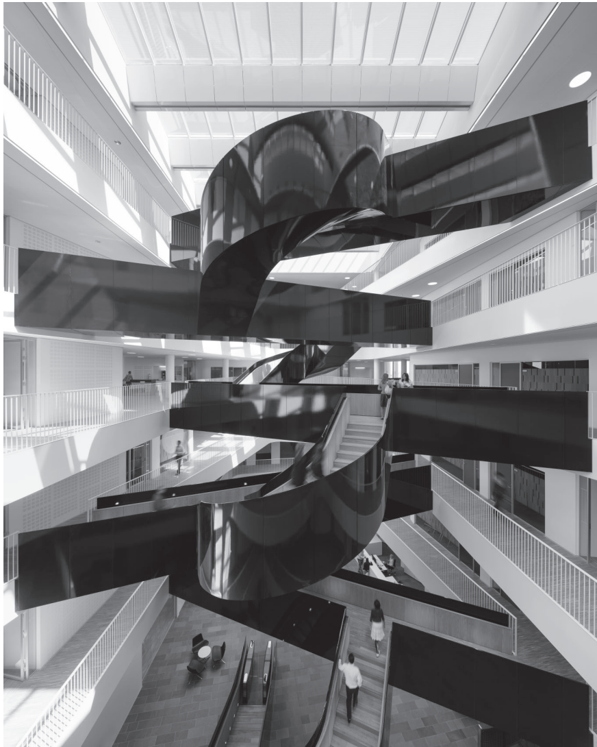
FN Byen centrale kerne udgøres af denne elegante hovedtrappe designet af 3XN.