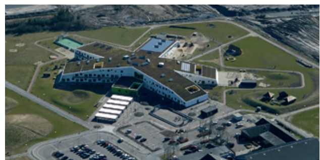
STJERNEN – NY SKOLE OG DAGINSTITUTION I HERNING

Hvordan skaber vi rammer, der giver plads til nye måder at gøre tingene på? Herning Kommune giver tre bud. Første stop er skole- og daginstitutionen Stjernen , der med energibevidste løsninger, sine fem arme og fællestorv nytænker børneinstitutionen. Vi besøger Herning Boldklub , der for nylig har udvidet sine faciliteter til et 'Fodbold-eksperimentarium', der rummer træningsmuligheder for både eliteidrætten, bredden og dem, der bare har lyst til at lege. Og så skal vi besøge Naturrum Skovsnogen – en privat skov, hvor en 35 meter lang skovsnog tager imod sammen med en lang række andre kunstværker.