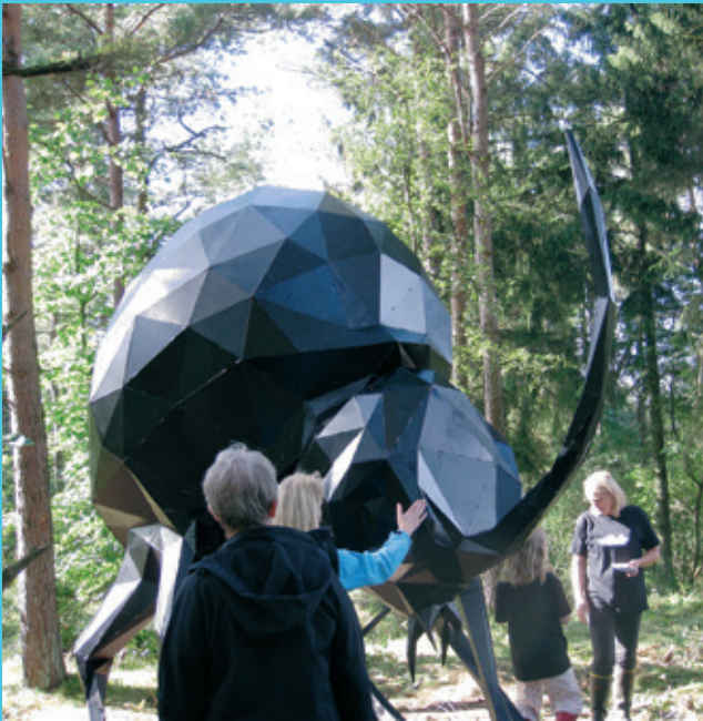
NATURRUM OG BYRUM I HERNING