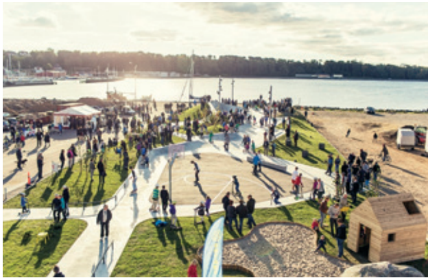
NY SKATERPARK VED LEMVIG HAVN