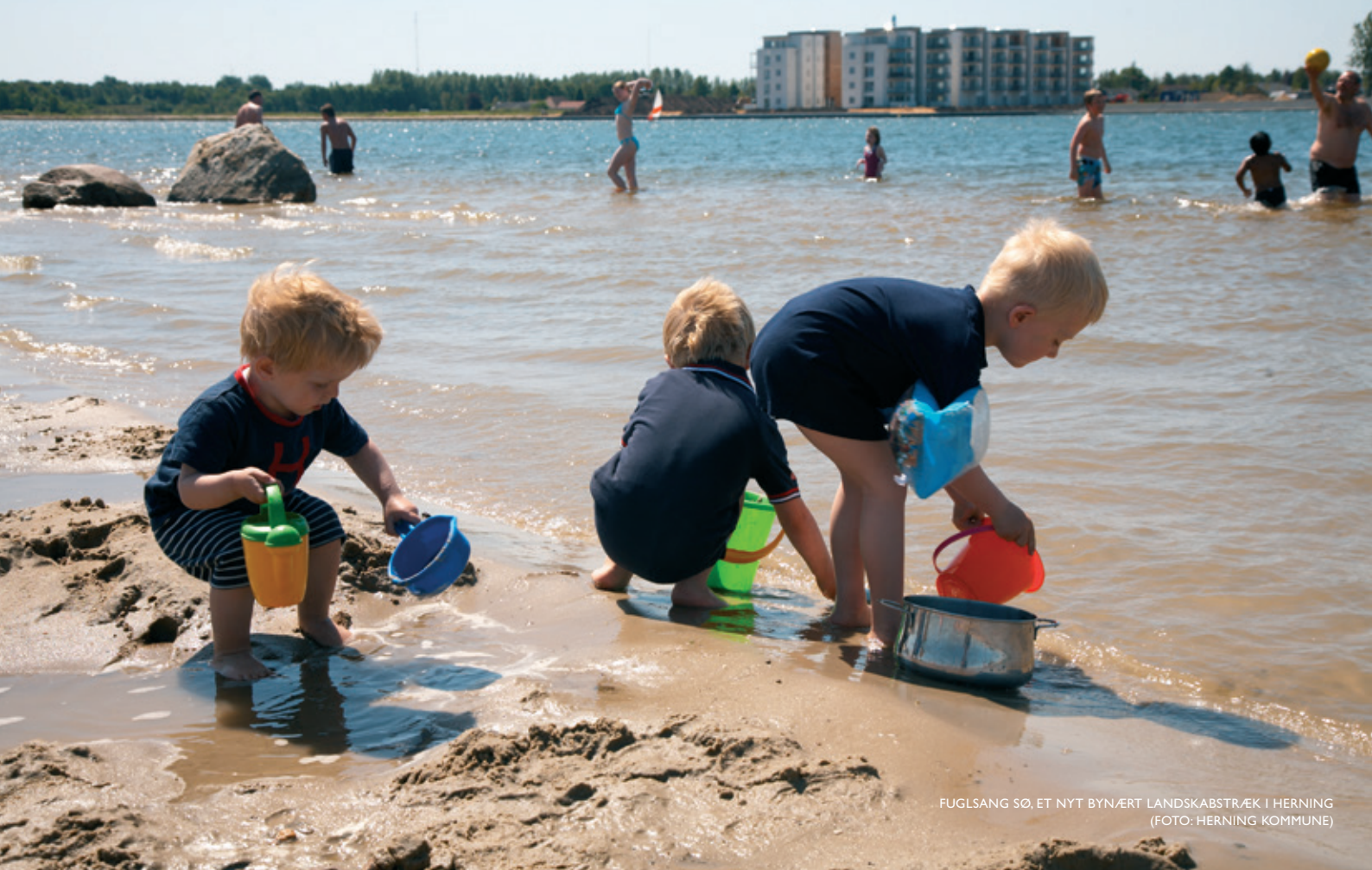
FUGLSANG SØ, ET NYT BYNÆRT LANDSKABSTRÆK I HERNING