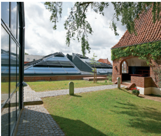
STRUER MUSEUM