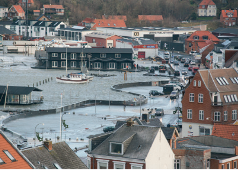
SLYNGET HØJVANDSMUR I LEMVIG HAVN