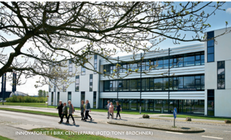
INNOVATORIET I BIRK CENTERPARK

Der tages forbehold for ændringer i udflugtsprogrammerne.