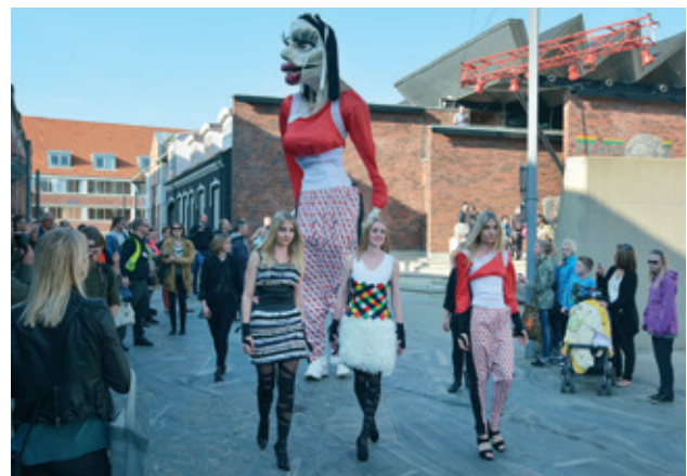
ALTERNATIVT MODESHOW – ET LILLE HJØRNE AF KULTURLIVET I HERNING

Et levende og dynamisk centrum er byens hjerte. På denne byvandring besøger vi Kulturgården , som er den fælles legeplads for en række kulturinstitutioner, der har til huse i en nedlagt skole. Næste stop er det nyåbnede Herning Bibliotek , hvor vi skal høre om tankerne bag det innovative bibliotek og husets rolle i midtbyen. Vi skal se sivegaden Bredgade Vest , hvor der er lavet forsøg med at åbne gågaden for ensrettet biltrafik som "shared space". Vi besøger desuden byomdannelsesområdet Thrigesvej , der tidligere var præget af tung industri, men i dag er et moderne boligområde tæt på centrum.