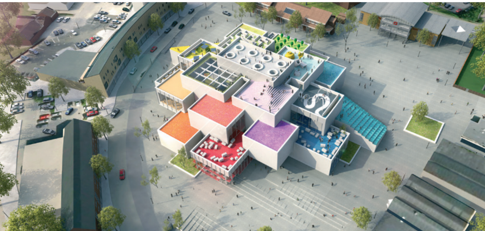
LEGO-HUSET I BILLUND

nelsesprojekterne har fokus på klimatilpasning, fx åbning af Billund bæk, der løber gennem bymidten. Sidst besøger vi virksomheden LEGO og får en smagsprøve på, hvordan de arbejder. Vi afprøver en metode til ideudvikling – og finder ud af, hvordan vi kan lade os inspirere af LEGO's metoder i byplanlægningen.