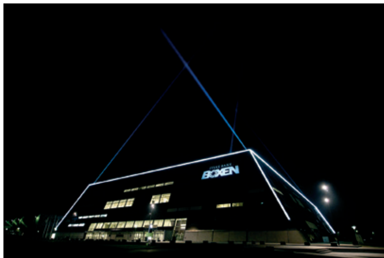
JYSKE BANK BOXEN I HERNING

Vi besøger nogle af de projekter, der allerede har – eller i de kommende år vil få – stor betydning for Herning-egnen. Første stop er Herringholms Gymnasium , som danner rammen for et teknisk gymnasium med undervisning inden for entreprenørskab og international økonomi. Herefter fortsætter vi til MCH , som med messehaller, kongrescenter, fodboldstadion og Jyske Bank Boxen er midtpunkt for store sports- og kulturarrangementer. Sidste destination er Gødstrup , hvor byggeriet af det nye regionshospital er i gang. Vi besøger byggepladsen og 'innovationsstalden', hvor der afprøves nye løsninger til det store byggeri. Ved siden af hospitalet arbejder kommunen med planlægningen af en 'Ny Nordisk By'.