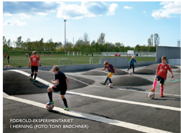
FODBOLD-EKSPERIMENTARIET I HERNING