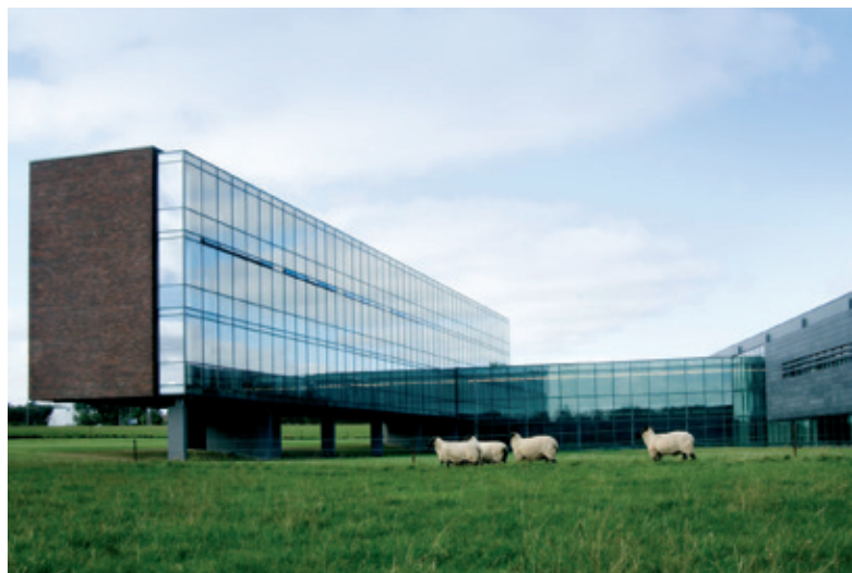
B&amp;O'S DOMICIL I STRUER