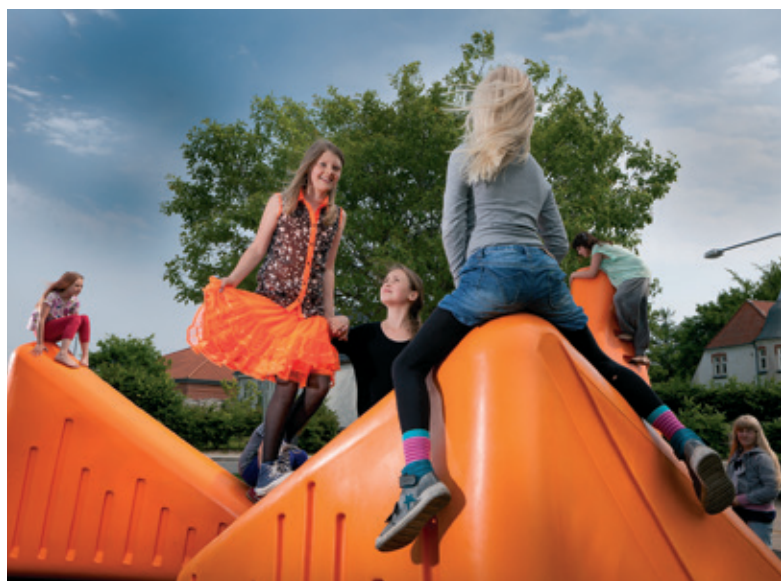
NYT TORV I NØRRE SNEDE

Udflugten går til de to mindre provinsbyer Bording og Nørre Snede, hvor nye former for borgerinddragelse bliver afprøvet i disse år. Først til Bording, hvor vi skal på byvandring til hovedgaden, brandtomten, hallen og friluftbadet Beach Bording . Undervejs hører vi den gode historie om både fysisk og mental forandring af byen og foreningslivet. Efter frokost tager vi videre til Nørre Snede, hvor vi igen er på byvandring: fra busstationen med de gule bystole videre til Kulturbanken, og til byens nyistandsatte torv, hvor vi sætter os på bjerget. Også her møder vi byens ildsprudlende sjæle, der fortæller om skraldespande, sammenhold og synergi .