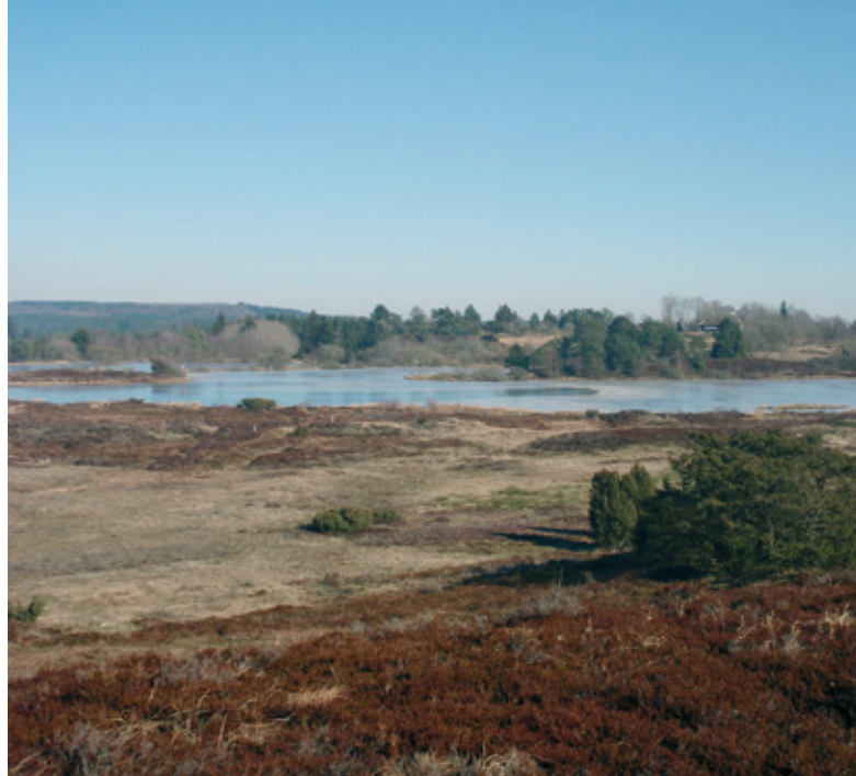
STILLEOMRÅDET SALTEN ÅDAL

17 % af Silkeborg Kommunes areal er udpeget som stillesteder, dvs. steder, hvor der ikke må planlægges for støjende og lysforurenende aktiviteter. Udflugten foregår til fods, med bus og med tog igennem kommunens største stilleområde, Salten Ådal , der er på størrelse med Københavns Kommune. Vi besøger enestående og uforstyrrede landskaber og naturområder, hvor vi får indblik i tilgængelighedsdiskussioner og besøger havørnens rige. På Vrads Station vil der være et oplæg om Stillesteder samt kommunens anvendelse af landskabskarakter-kortlægning. Herefter tager vi veterantoget fra Vrads Station til Bryrup, med stop med udsigt til Lystruphøve Efterskole . Her vil der være stilhed.