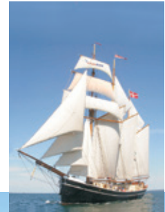
HVIDE SANDE OG SKONNERTEN MAJA

Lemvig Kommune har megen erfaring med arbejdet med at få områdefornyelse og indsatspuljer til at gå hånd i hånd med en boligsocial indsats. Vi lægger ud med en byvandring i landsbyen Bækmarksbro, hvor vi ser eksempler på områdefornyelse, nedrivninger og anvendelse af byggetomter, samt indsatsen for de bevaringsværdige ejendomme. Frokost spises ved Bovbjerg Fyr på kanten til Vesterhavet. Herefter tager vi på byvandring i Lemvig Havn , som siden 2010 har gennemgået en forvandling. Vi ser den nyanlagte skaterpark , Lemvig Bedding og det centrale havnestræk, som i dag har en slyngget højvandsmur, der integrerer byrums- og klimatilpansningsfunktioner. Vi slutter vandringen af i den vestlige del af havnen, hvor nye faciliteter til sejlere og fritidsfiskere er ved at blive etableret.