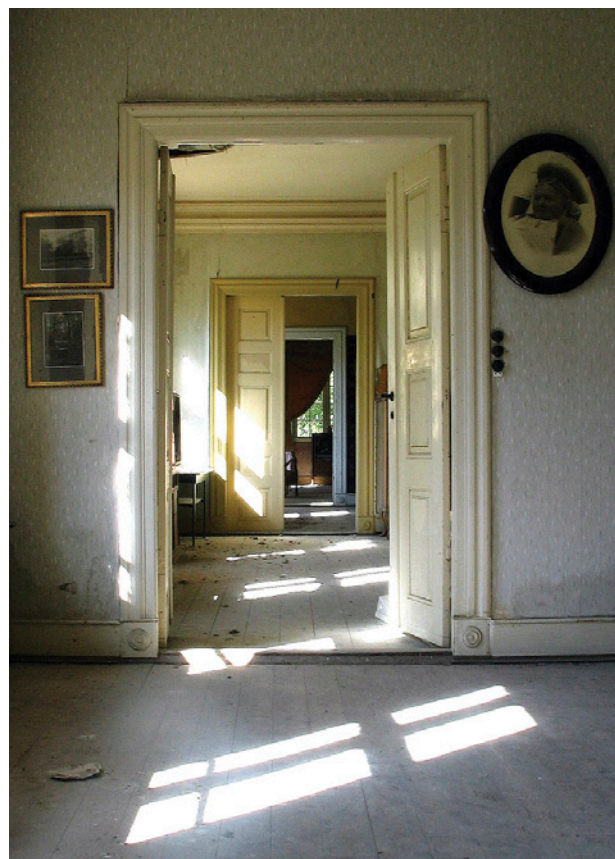
Fig. 5. Det har ikke til nu været en metodisk udviklet disciplin at beskrive mere sanselære indtryk i bygningsundersøgelser. Der eksperimenteres dog i uddannelsen med at udarbejde arkitektoniske beskrivelser, der fortæller om konkrete arkitektoniske idéer og træk ved en historiske bygning og samtidig søger at redegøre for mere uahåndgribelige fænomener – f.eks. rums atmosfære, stemning, lyskvalitet osv. Ullerup Hovedgård på Mors. Foto LNB 2003.

at prøve at få tingene til at hænge sammen. Virkeligheden er knap så enkel. Der er det i høj grad andres »programmer«, der kommer ind og styrer projektet. Men her kan og bør arkitekten bruge sin viden og sit