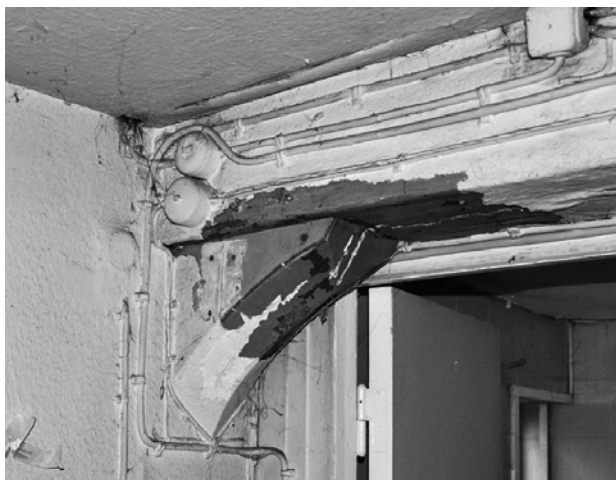
Fig. 4. At finde, identificere og formidle spor efter oprindelige byggeperioder og ombygninger samt tolke disse er en central del af bygningsarkæologien i arkitektfaget. Dette øves i uddannelsen i forbindelse med bygningsopmålinger.

Fasen undersøgelse består i sig selv af forskellige delelementer. Ingen af dem er i sig selv revolutionerende, men det tilstræbes hele tiden at tage nye metoder og teknikker i brug, når det er muligt og skønnes nyttigt. Det skal understreges, at der er grænser for hvilke faglige kompetencer, der kan bringes i spil, og hvilken type undersøgelser der undervises i. Men der arbejdes i grove træk med følgende undersøgelsestyper på bygningsniveau: