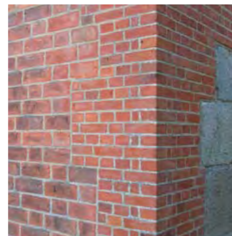
Vedligeholdelse og næsten anonyme ændringer vil ofte være en del af opgaven for arkitekten, der restaurerer. Her er intet heroisk eller personbåret genialt at fotografere til de kulørte fagtidsskrifter. Tårndetalje fra middelalderlig kirke i Daler.

Restaureringsbegrebet omfatter alle skatrin: Fra detaljer til helheder, fra det regionale til det internationale. Holdninger, udgangspunkter og målsætninger varierer til stadighed, hvad enten det er en lille bygning