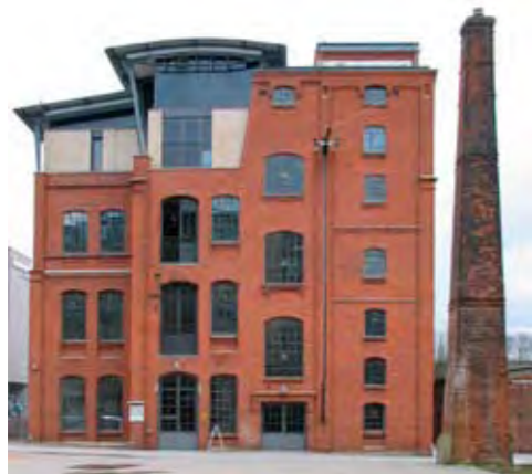
Ombygninger og tilføjelser er ofte nødvendige, hvis en historisk bygning skal ændre brug og have nyt liv. Den historiske proces synliggøres, og en berigende dimension af tid lægges til oplevelsen. Planerkollektiv, Museum der Arbeit i Hamburg.

der tilsammen danner og støtter det kunstneriske i faget?