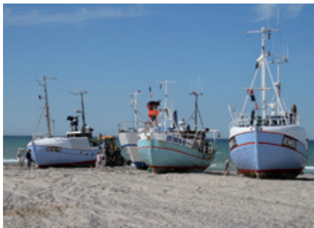
FISKERBÅDE PÅ THORUP STRAND