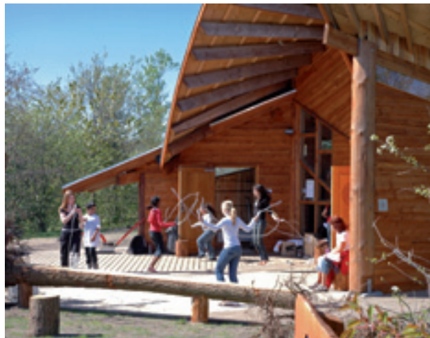
SOMMERFUGLEN, BORGERNES HUS I AALBORG ØST

Udflugten giver et indblik i, hvordan forskere samarbejder med bydele, kommuner og byens aktører i øvrigt. Vi besøger Aalborg Universitet og Aalborg Øst, og præsenteres for en række forskningsprojekter, der alle inddrager byens aktører. Det drejer sig om projekter indenfor by- og havneomdannelse. Kulturprojekter og deres rolle i byudviklingen, turismeudvikling i Region Nordjylland samt mobilitet i byen, borgernes bevægelsesmønster og deres brug af byens rum. Et hold unge forskere vil guide os rundt i Aalborg Øst og fortælle om deres arbejde med bydelen. Det store byomdannelsesprojekt, som boligforeningen Himmerland har planlagt for bydelen vil også blive præsenteret på udflugten.