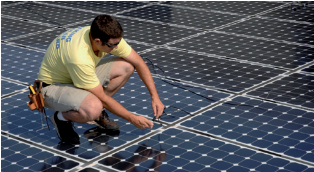
SOLVARMEANLÆG I DET NORDJYSKE