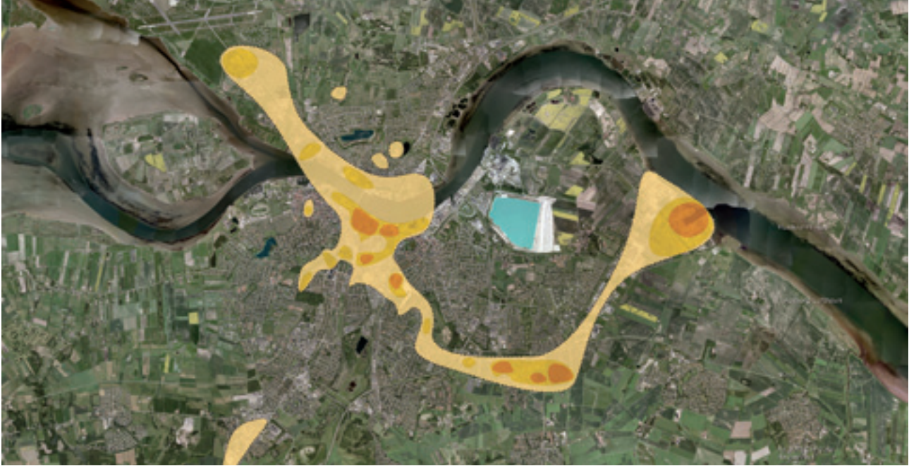
VÆKSTAKSEN I AALBORG