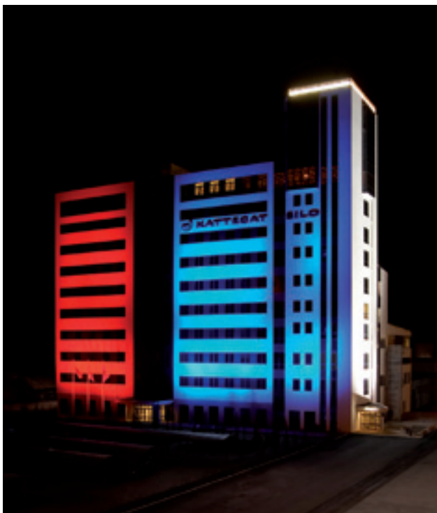
KATTEGATSILOEN OG VUE OVER HAVNEN I FREDERIKSHAVN

Hvordan skabes på kort sigt nye arbejdspladser til erstatning for de tabte? Hvordan kan kommunen blive synlig og attraktiv – og udnytte de uanede muligheder, som ligger på det globale maritime marked? Og hvordan sikres på længere sigt tilstrækkelig og kompetent arbejdskraft på det fremtidige tilsynsladende umættelige maritime marked?