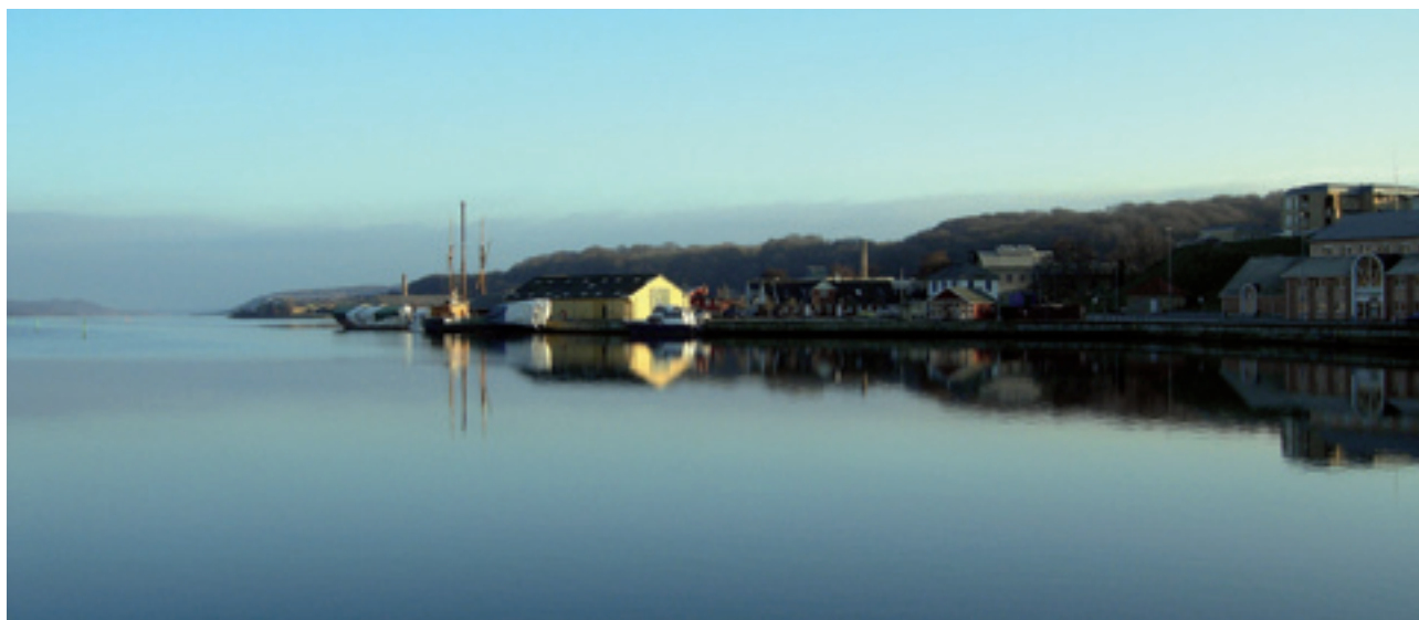
MARIAGERFJORD VED HOBRO

På udflugten skal vi se og høre om hvordan Jammerbugt Kommune satser på det lokale og unikke i den globale konkurrence om hvad vi skal leve af i fremtiden. Vi skal se et moderne landbrug og høre om driften, set i lyset af kommunens planlægning for jordbrugets fremtid. Vi skal til Slettestrand og se Han Herred Havbåde, der blandt andet arbejder med restaurering og nybygning af havbåde. Ildsjælene fra havbådeforeningen vil blandt andet fortælle om processen med at få bragt kystfiskeriet tilbage til Slettestrand. Vi kører forbi Svinkløv Badehotel og Thorup Strand, hvor vi skal opleve kvalitetsturismen og fiskerbåde i aktion.