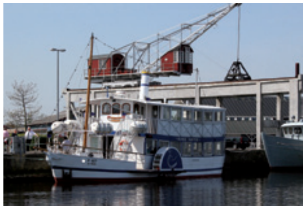
SVANEN OG KRANEN

Udflugten tager udgangspunkt i Mariagerfjord Kommunes kulturarvskommuneprojekt: Dejlig er Fjorden. Det har altid været attraktivt at bosætte sig ved vand og fjordområdets historie udspringer af vandet i midten. Vi besøger byerne Hadsund, Mariager og Hobro og hører om byernes og fjordlandskabets udvikling igennem tiderne. En fortælling Mariagerfjord Kommune bruger, når de planlægger for deres byer og landskaber. Tidligere bandt vandet området sammen, men nu skiller det området – og det er en stor udfordring for fællesskabet. Vi vil spise frokost på hjuldamperen Svanen og opleve fjorden fra vandsiden.