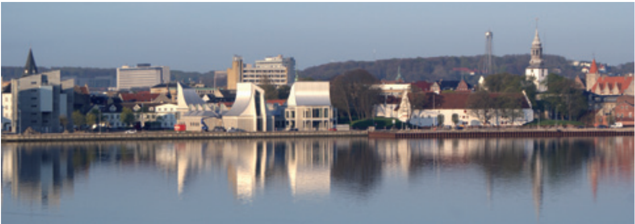
HAVNEFRONTEN VED AALBORG BYMIDTE

Der tages forbehold for ændringer i udflugtsprogrammerne.