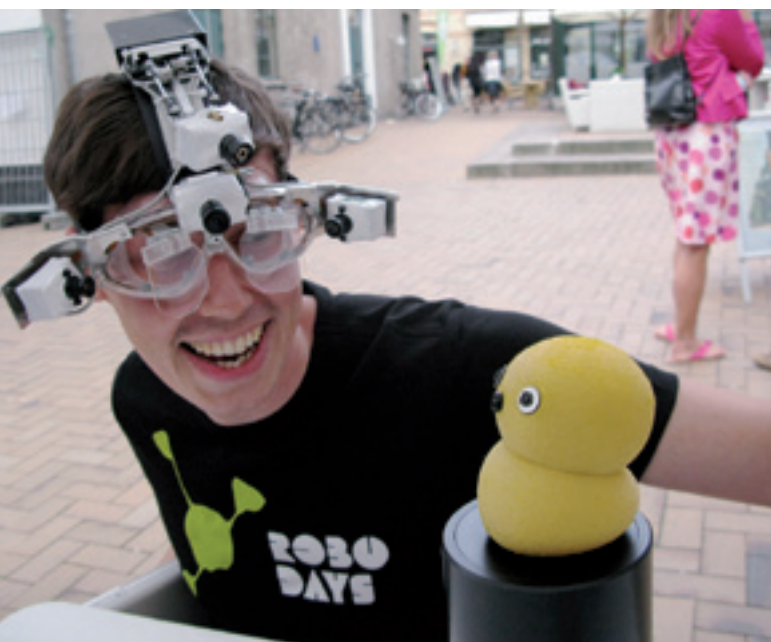
I DEN VIRTUELLE VERDEN