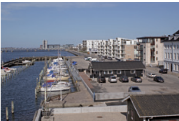
HAVNEFRONTEN VED NØRRESUNDBY

bad og andre udfoldelsesrum, restauranter og kulturelle funktioner, der har skabt nye forbindelser fra byen til vandet. På gå- og sejlturen langs Aalborg og Nørresundby havnefronter kommer vi forbi byggepladsen til Musikkens Hus, det nye shoppingcenter Friis med tilhørende byrum og besøger Utzon Centret. Undervejs hører vi om, hvordan kommunen har udviklet strategier og metoder for at sikre kvalitet og ejerskab til havneområderne.